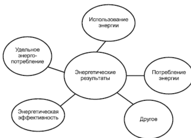
Рисунок А.1 - Концептуальное представление энергетических результатов

Концептуальное представление энергетических результатов приведено на рисунке А.1.